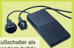
Fußschalter als Sonderzubehör 307 216