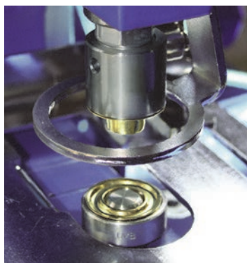
Öse und Scheibe einlegen