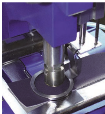
Stanzen und Pressen