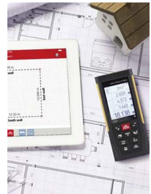
Datenübertragung per Bluetooth