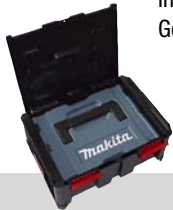
MAKPAC / SYSTAINER Gr. 1 passt in BOXonBOX Nr. 2

BOXonBOX Nr. 3 komplett mit 2 Werkzeugstecktafeln, versetzbar